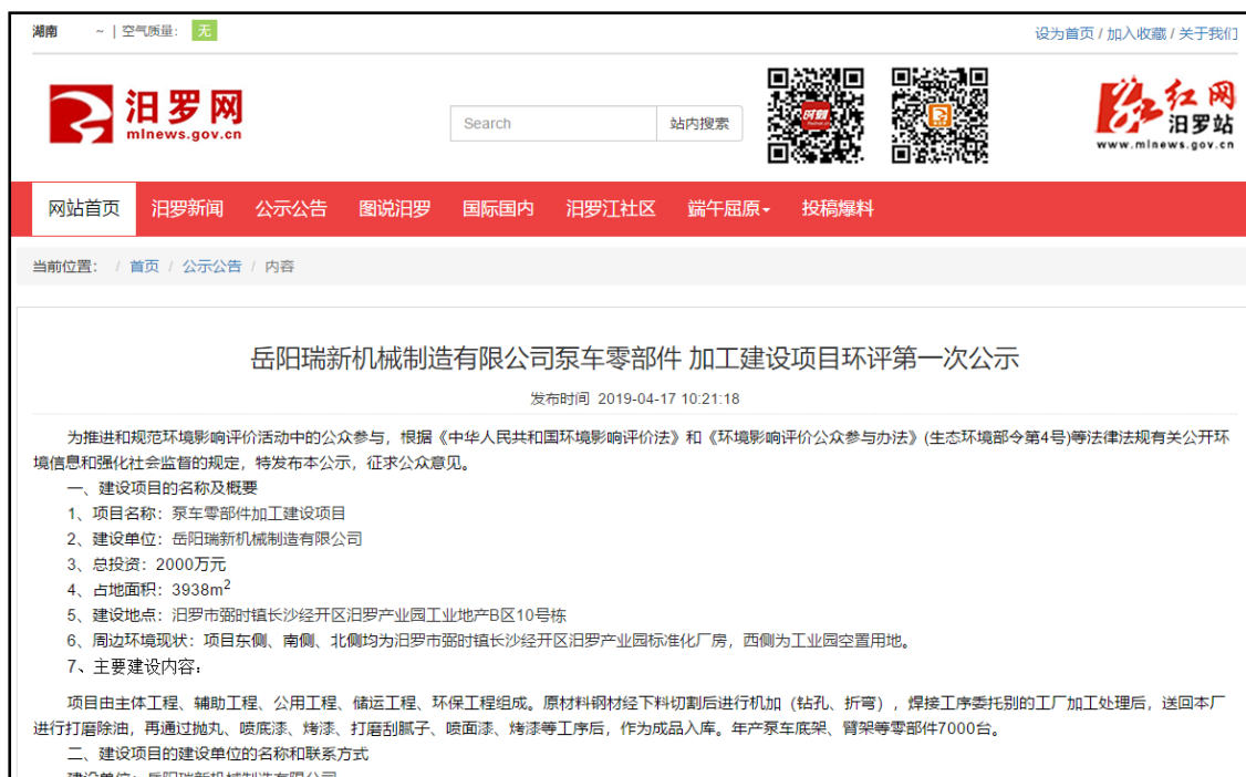
图1 第一次网络公示截图

http://www.mlnews.gov.cn/index.php?m=content&c=index&a=show&catid=596&id=26890