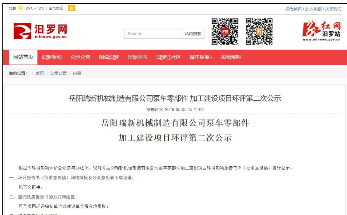
图 2 征求意见稿网络公示截图