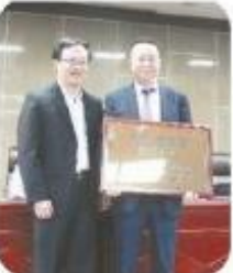
嘉信市第一人民医院院长、党委书记、副院长等参加引进仪式

海扶刀手术,即超声聚焦热消融术,是一种微创治疗子宫肌瘤的方法。它通过聚焦超声波能量,精准地作用于肌瘤组织,使其凝固坏死,从而达到治疗的目的。与传统手术相比,海扶刀具有创伤小、恢复快、无疤痕等优点,深受广大患者的青睐。海扶刀手术适用于各种类型的子宫肌瘤,特别是那些不适合手术切除的患者。通过海扶刀治疗,患者可以在较短的时间内恢复健康,且不会影响正常的月经周期和生育功能。